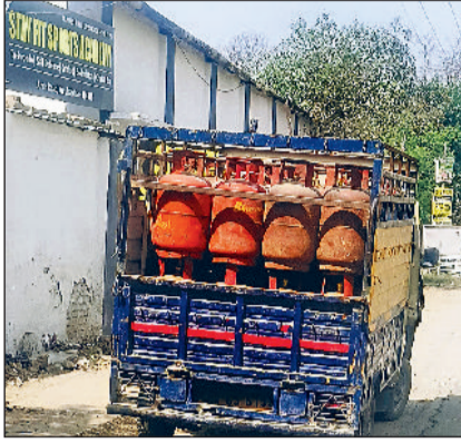
कुरुक्षेत्र। सिलेंडरों से भरी गाड़ी।

ईरान और अमेरिका-इजराइल युद्ध का असर अब गैस सप्लाई पर दिखाई देने लगा है। ऑयल कंपनियों ने कमर्शियल एलपीजी सिलेंडरों की सप्लाई पर रोक लगा दी है। इसका सीधा असर होटल, रेस्टोरेंट आदि पर दिखाई देने लगा है। ऑयल कंपनियों के इस फैसले से मैरिज गार्डन भी प्रभावित हुए हैं। कामर्शियल सिलेंडर की आपूर्ति बंद होने से पूरे शहर में इसी तरह की समस्या खड़ी हो गई है। सिलेंडर की आपूर्ति न होने से खोमच, ठेलों से लेकर रेस्टोरेंट-होटलों तक संकट गहराने लगा है। जिनके पास अभी स्टॉक है, वे तो काम चला रहे हैं, जब एलपीजी समाप्त हो गई है वे असमंजस में हैं कि आखिर प्रतिष्ठानों का संचालन कैसे किया जाए। इसके पहले ऑयल कंपनियों ने घरेलू गैस सिलेंडर की डिलीवरी का समय भी बढ़ाकर 25 दिन कर दिया था, जिससे गैस सिलेंडर की सप्लाई का सामना रखा जा सका और लोक अनायास रूप से गैस की रिफिल कराकर न रखें। उधर