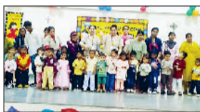
यमुनानगर रादौर स्थित स्वराज शिशु निकेतन स्कूल में आयोजित कार्यक्रम में भाग लेते बच्चे व स्टाफ सदस्य।