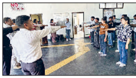
यमुनानगर। सरकारी कॉलेज में शपथ ग्रहण करते विद्यार्थी व स्टाफ सदस्य।