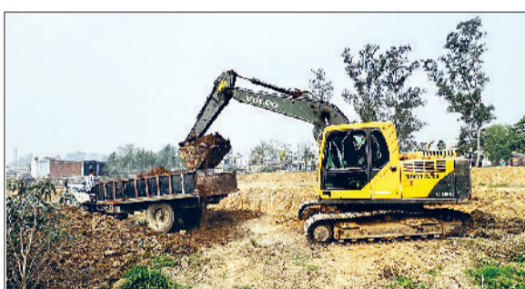
यमुनानगर के रादौर तहसील में उप जिला सचिवालय को लेकर शुरू हुआ कार्य