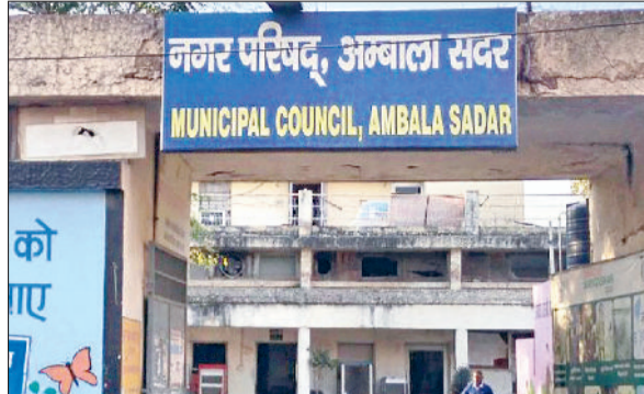
अंबाला। नगर परिषद ऑफिस का बाहरी दृश्य।