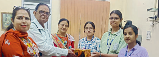
यमुनानगर। रादौर स्थित जेएमआईटीआई इंजीनियरिंग कॉलेज में मेधावी छात्रों को सम्मानित करते आयोजक।

जेएमआईटीआई इंजीनियरिंग कॉलेज रादौर में बुधवार को युवा रेड क्रॉस सोसायटी के तत्वावधान में फ्रैफ्टी वॉल पेंटिंग प्रतियोगिता का आयोजन किया गया। प्रतियोगिता का उद्देश्य विद्यार्थियों में रचनात्मकता के साथ-साथ सामाजिक जागरूकता को बढ़ावा देना था। प्रतियोगिता में विभिन्न विभागों के विद्यार्थियों ने उत्साहपूर्वक भाग लिया और कॉलेज परिसर की दीवारों पर रक्तदान, स्वच्छता, पर्यावरण संरक्षण, नशा मुक्ति तथा सामाजिक सेवा जैसे विषयों पर आकर्षक चित्र बनाकर अपने विचार प्रस्तुत किए। विद्यार्थियों की कलात्मक