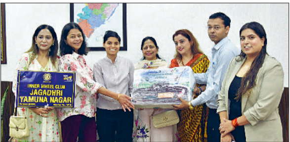
यमुनानगर। उपायुक्त कार्यालय में वैंडिंग मशीन भेंट करते क्लब के सदस्य।