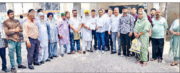
बराड़ा। चेयरमैन को ज्ञापन सौंपते हुए लोग।

लाल डोरा मुक्त योजना के तहत जमीनों की रजिस्ट्री का इंतजार कर रहे लाभार्थियों का धैर्य अब टूटने लगा है। नगर पालिका सचिव के सुस्त रवैये से नाराज लोगों के एक प्रतिनिधिमंडल ने बुधवार को नगर पालिका कार्यालय पहुंचकर रोष जताया और अपनी मांगों को लेकर नगर पालिका प्रधान को ज्ञापन सौंपा। लाभार्थियों का आरोप है कि पूर्व में तैनात सचिव के कार्यकाल में इस योजना पर तेजी से काम हुआ